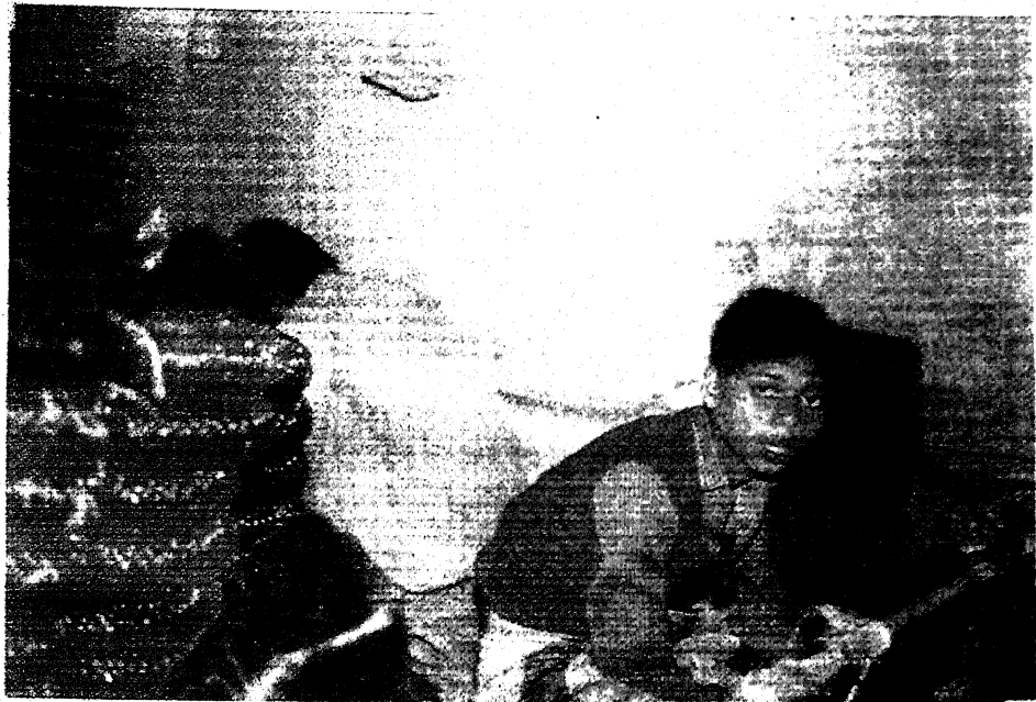
1. फिरोजाबाद की चूड़ी फ़ैक्टरी में एक बाल मजदूर